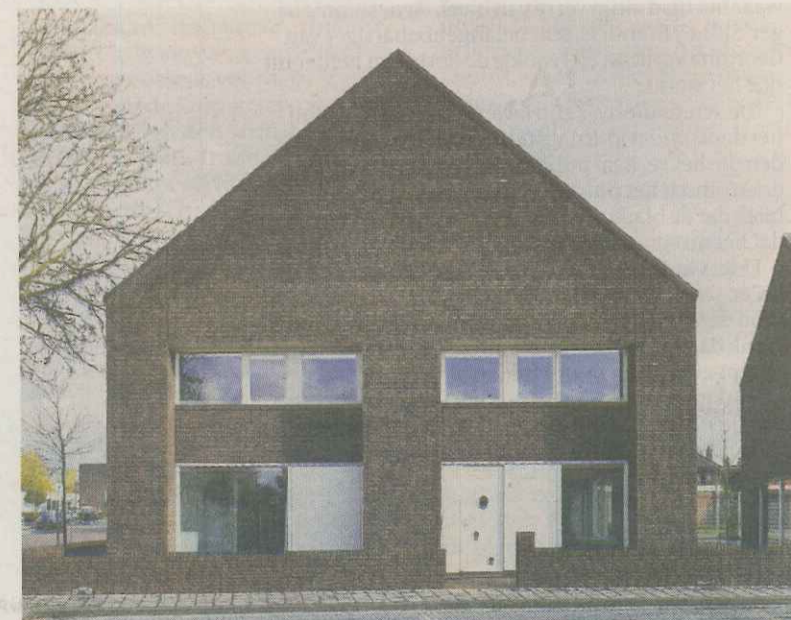
Woningbouw in de wijk Berflo Es Zuid, Hengelo, door Korth Tielens.