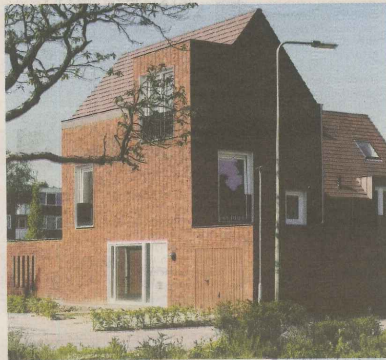
Sociale woningbouw in Brunssum, door Jo Janssen en Wim van den Bergh.